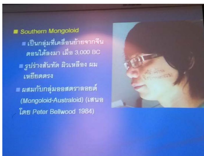
(图为老师向我们展示他的调研成果)

泰国历史课，由一位非常具有个性和创新精神的老师教授。不同于一般老师按照时间顺序介绍泰国历史，他根据地理区域，并结合自身的实地考察经验，为我们生动介绍“枯燥而难懂”的历史。每逢难以解释的单词，老师还会现场画画解释。为了让我们更好地理解兰那泰王国的历史，老师还自费带领我们去清迈和清莱，参观清迈博物馆，游览素贴山，等等，寓教于乐。